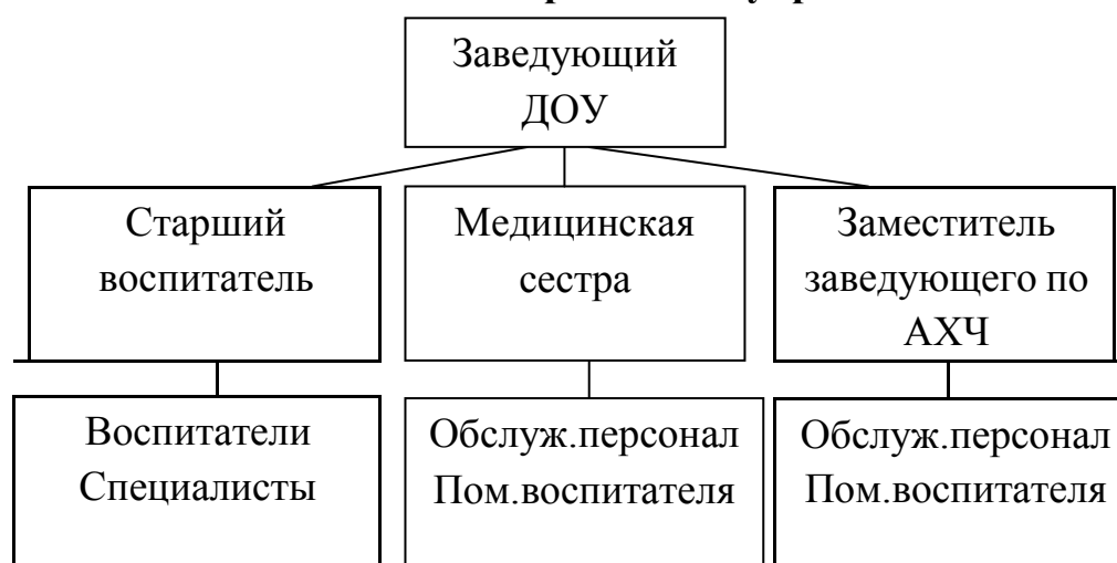
Схема административного управления